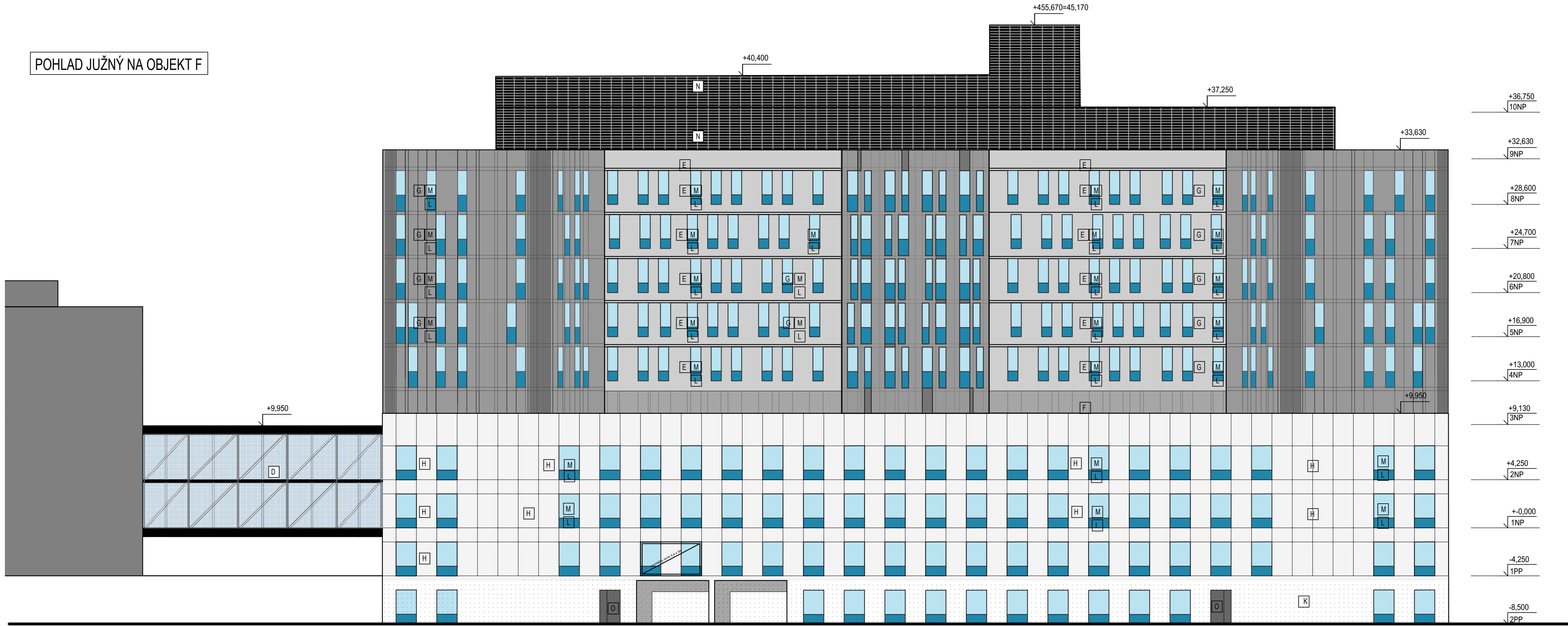
POHLAD JUŽNÝ NA OBJEKT F